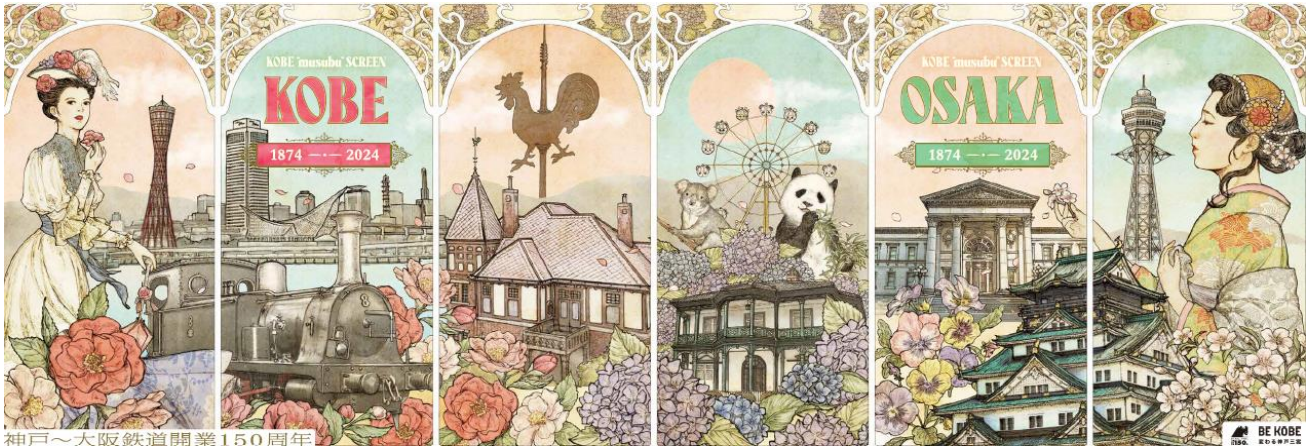
神戸～大阪鉄道開業150周年