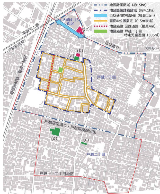
戸越一・二丁目地区の整備状況