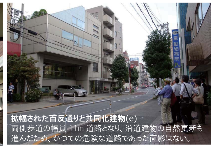
拡幅された百反通りと共同化建物(e) 両側歩道の幅員 11m 道路となり、沿道建物の自然更新も進んだため、かつての危険な道路であった面影はない。