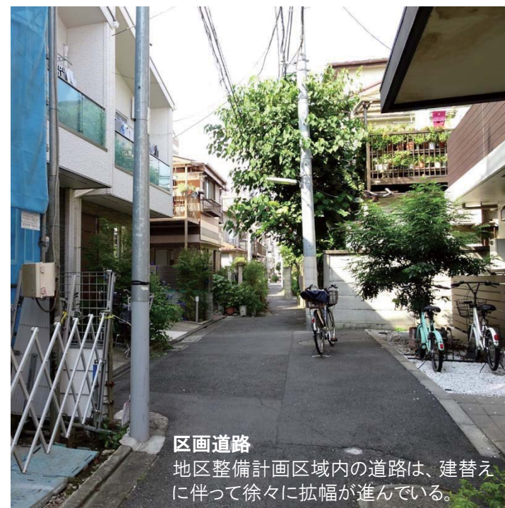
区画道路 地区整備計画区域内の道路は、建替えに伴って徐々に拡幅が進んでいる。