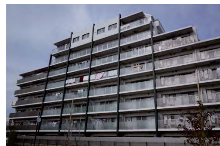
防災街区整備事業(事業区域0.4ha、従前は無接道を含め14棟の建物と区のみまちづくり用地があつたが、60戸の共同住宅と個別利用区が整備された。)