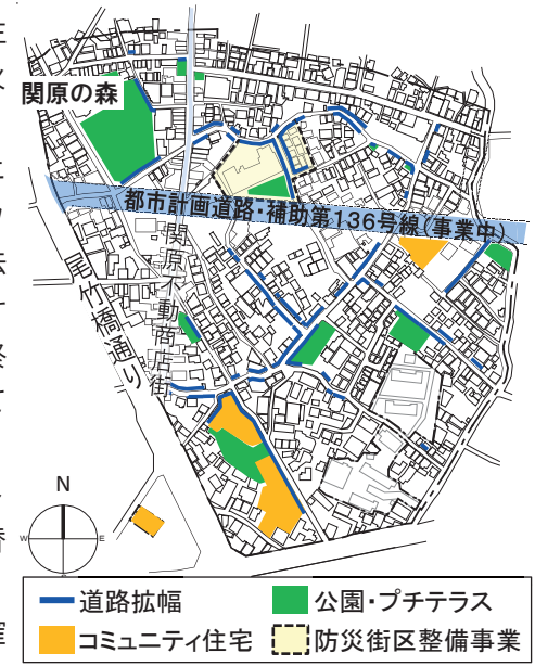
関原一丁目地区の整備実績