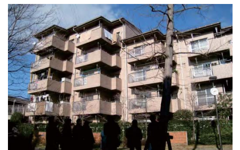
コミュニティ住宅(事業協力者のための区営の賃貸住宅。地区内に7棟68戸整備されており、地域開放型の集客室を備えたものや、エレベーター付のものもある。)