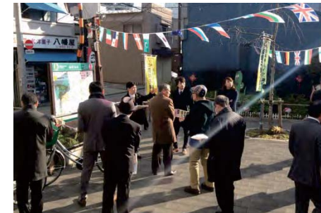
プチテラス(300㎡未満のポケットパークで地区内に6ヵ所整備されている。日常的な管理は地元の方にお任せしている。)