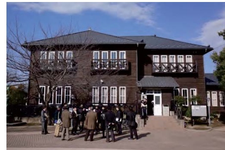
関原の森、愛恵まちづくり記念館(昭和5年築の元幼稚園舎で、閉園に伴い区が買収、集会所として整備した。)