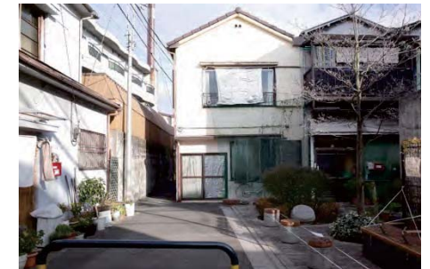
道路拡幅の様子(商店街と区道の角地。元々狭かった通路が、セツバックして拡幅された様子がわかる。)