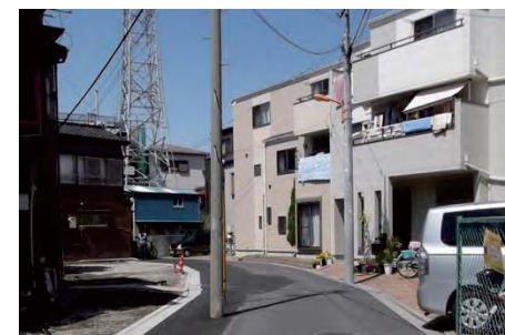
防災街区整備地区計画による整備箇所(従前は幅員3mに満たない道路の両側に住宅が密集していたが、地区計画に則つた建替えに伴い区が道路を整備した。)