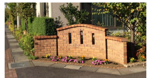
宅地のセットバックで生まれたストリート花壇