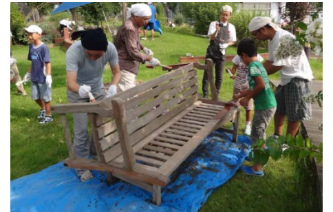
ベンチのペンキ塗りイベント。子どもたちも参加することで備品に愛着を持ってもらえる。