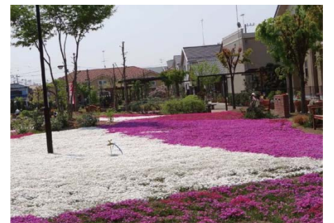
すみれ野中央公園の 4 月の様子。芝桜が見ごろになる。

一瀬氏：北鴻巣駅ができた時期から 30 年弱、すみれ野地区の近隣に居住。定年退職後に NPO の事務局長となり、3 年以上活動に取り組んでいる。