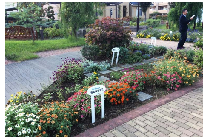
すみれ野中央公園に設けられたスポンサー花壇