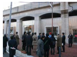
見学の様子 （黄金スタジオ）