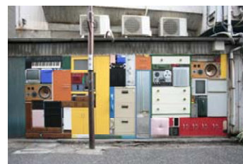
黄金町バザール 2012 出展作品 マイケル・ヨハンソン 「Recollecting Koganecho」