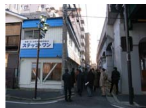
見学の様子 （防犯拠点 ステップ・ワン）