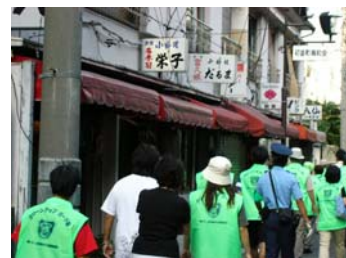
防犯パトロールの様子