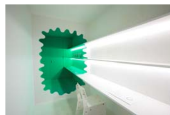
改装例「レッドライト・ヨコハマ」