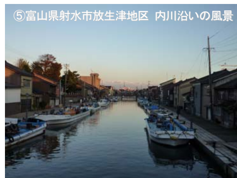
⑤富山県射水市放生津地区 内川沿いの風景