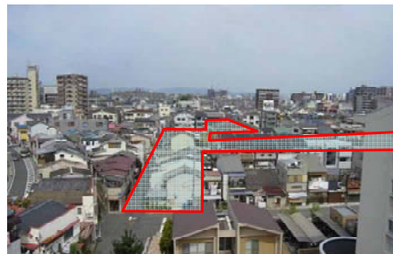
門真市本町地区(従前)