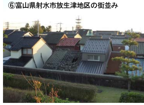
⑥富山県射水市放生津地区の街並み