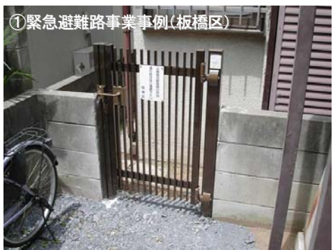
①緊急避難路事業事例(板橋区)