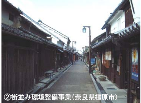
②街並み環境整備事業(奈良県橿原市)