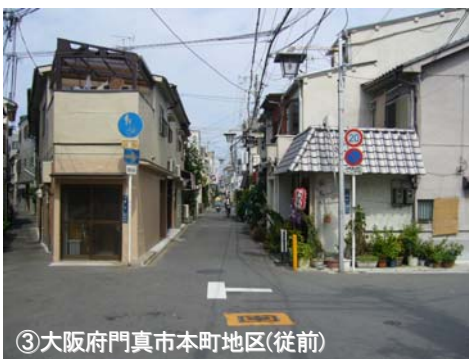
③大阪府門真市本町地区(従前)