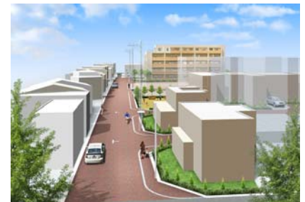
門真市本町地区(整備イメージ)