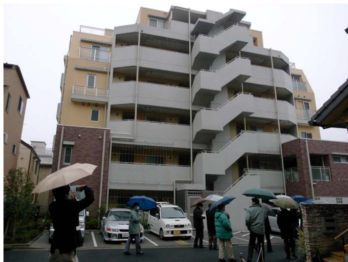
見学の様子（共同住宅『オーゼ上篠』）