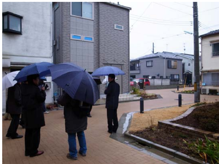
見学の様子（辻公園及び通り抜け道路）