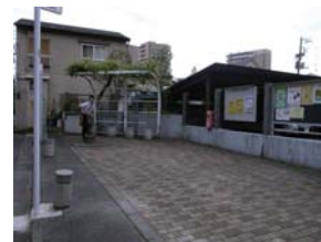
5 はとほっと(路地尊第5号)