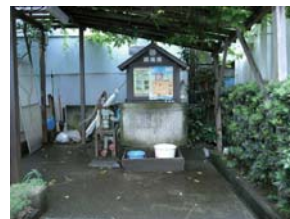
3 有季園(路地尊第3号)