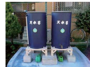
天水尊(家庭用雨水貯留槽)