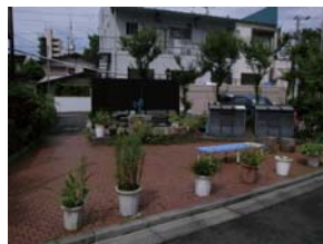
4 会古路地(路地尊第4号)