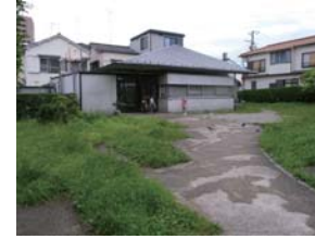
6 一寺言問広場・集会所