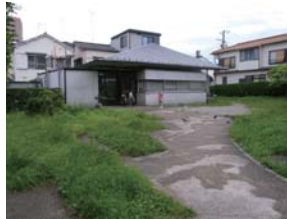
6 一寺言問広場・集会所