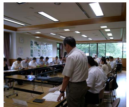
見学・交流会の様子