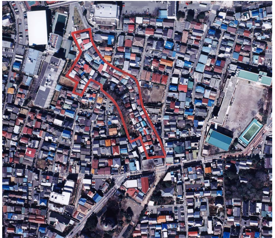
従前の大谷口上町地区