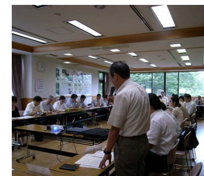
見学・交流会の様子