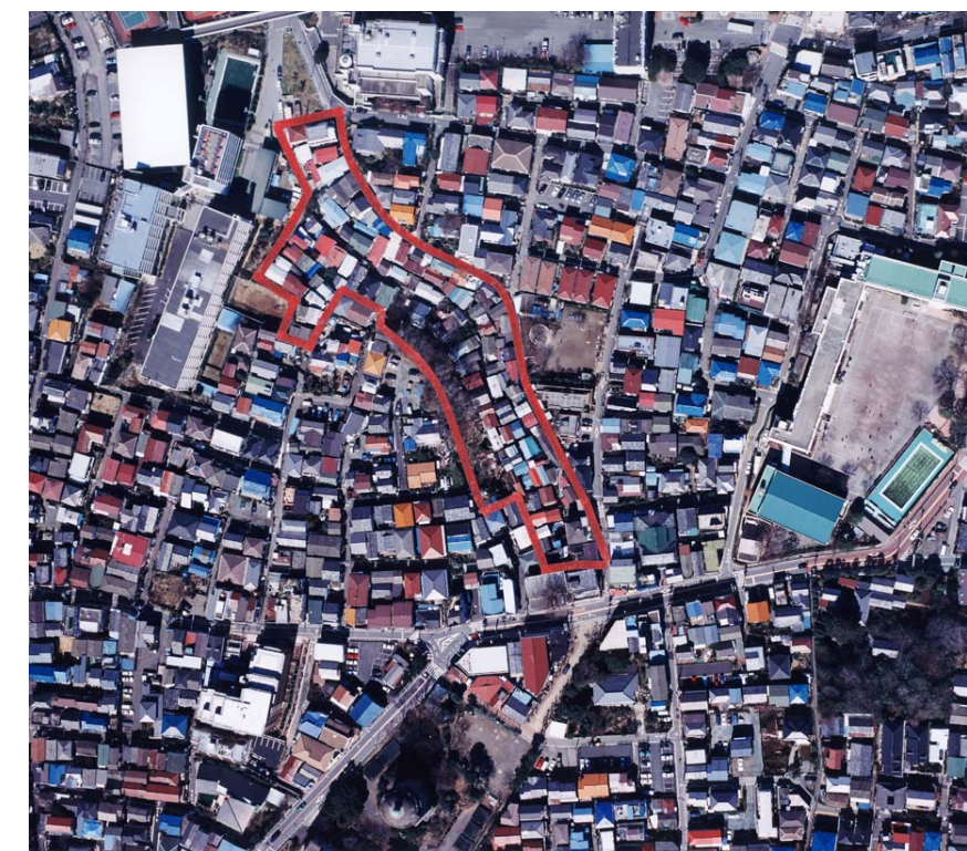
従前の大谷口上町地区