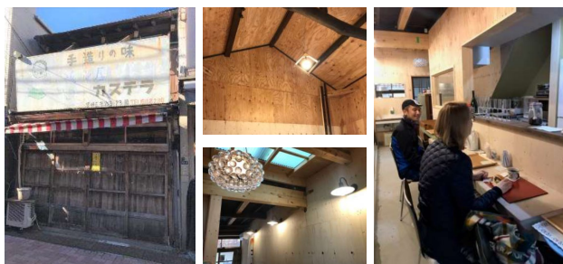
パン屋(ハト屋)の再生