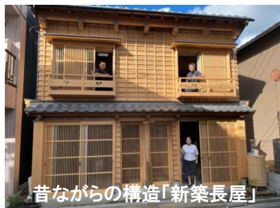
昔ながらの構造「新築長屋」