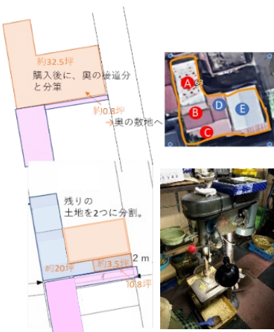
土地活用方策の検討

●コンサルタントの立場で都内の密集事業に携わっている。密集事業が進み道路拡幅やポケットパーク整備、建替え促進の成果があがっているが、防災性の向上と同時に解決すべき町工場や商店街の継続、暮らしの安心などの課題解消へ向け、土地の買収によるランドバンク事業も行っている。