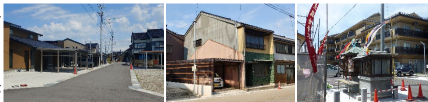
射水市放生津地区

※ 射水市放生津地区の取組みについては、かわら版第29号で詳細にご紹介しておりますので併せてご覧ください。