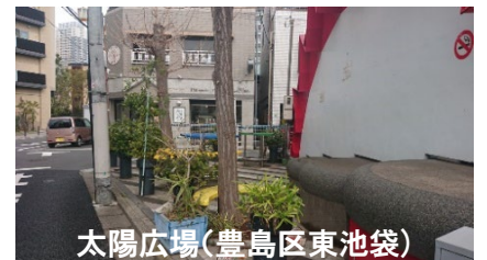
太陽広場(豊島区東池袋)