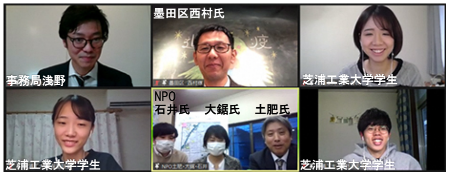
↑ 質疑応答・意見交換の様子

防災と福祉の拠点として、「燃えない壊れないまちづくりに関する講習」等防災に係る取組みと「ふじのき定食」や「防災子ども食堂」など地域福祉に係る取組みを行っている。