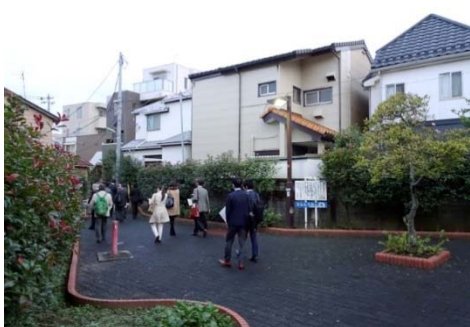
てんとうむし広場：行き止まりの解消を兼ねて整備されたポケットパーク