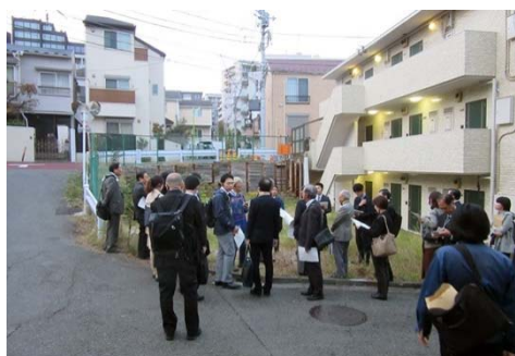
三太通り（重点交差点改良）：改良工事予定の高低差が大きいクランク箇所