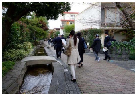
烏山川緑道：暗渠化された河川上部をせせらぎのある緑道として再生