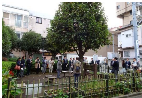
トンボ広場：町内のクラブが管理しているポケットパークの第1号