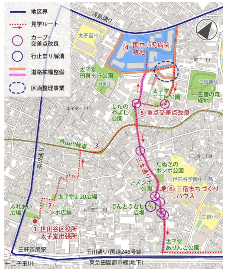
見学を行ったまちの改良箇所

修復型まちづくり ：都市計画事業とは異なり、道路拡幅や公園整備の際に、住民の建替えや移転のタイミングに合わせて徐々に整備を進める。スクラップアンドビルド型ではなく、住民の負担が少ない手法。