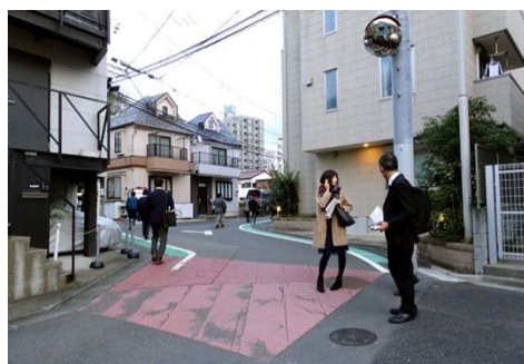
三太通り（クランク改良）：拡幅され見通しも良くなった整備後のクランク部分