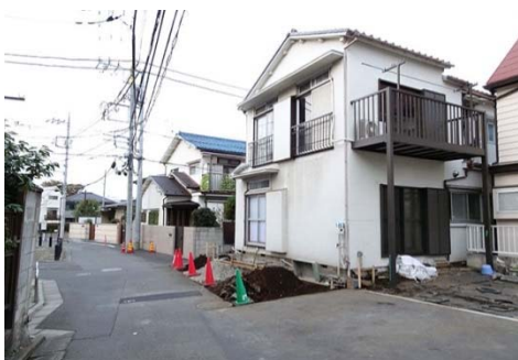
三太通り（拡幅整備）：広域避難場所への避難路として拡幅が進んでいる