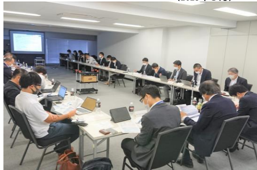
2022年9月 第1回日系企業スマートワーキンググループの様子