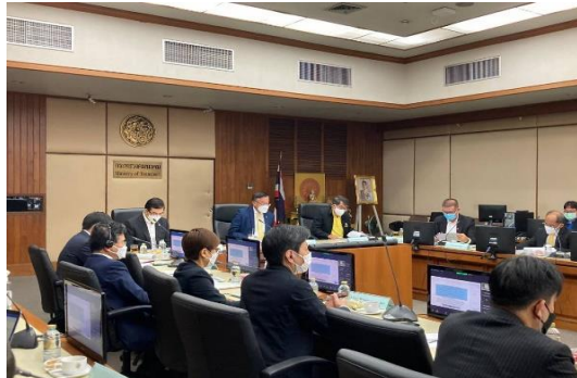
2022年6月 第3回バンズー地区ステアリングコミッティ (議長: タイ運輸事務次官) の様子