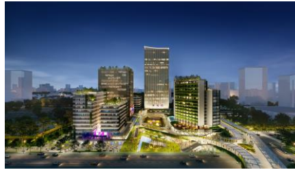
バンズーリーディングプロジェクトのイメージパス (2023年3月)