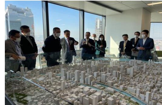
2022年12月 タイ副首相・運輸大臣のうめきた地区視察の様子