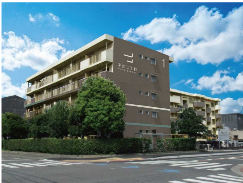
沖台二丁目団地外壁塗装完成イメージ図

このたび、学生による沖台二丁目団地の外壁色彩デザインが完成しましたのでお知らせします。このデザインの外壁塗装は、令和7年度夏頃の完成を予定しています。