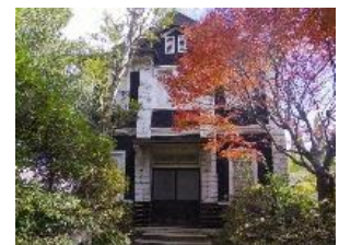
旧三宮堂田中医院(洋館)