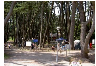
キャンプ場(震災前)