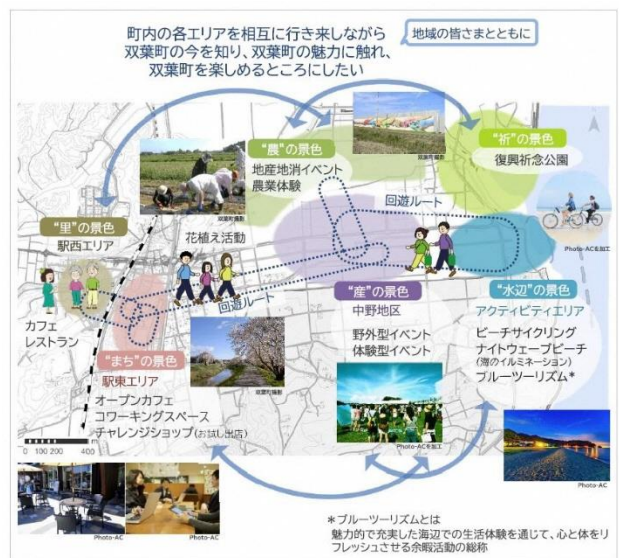
図 回遊ルートとアクティビティのイメージ