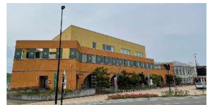
駅コミュニティセンター