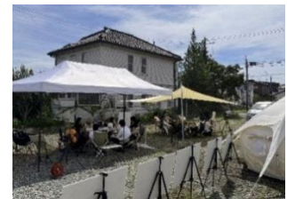
イベントのイメージ