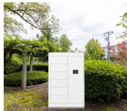
受取場所イメージ（CG）