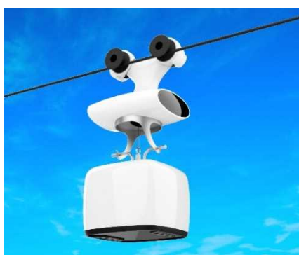
空中配送ロボット（CG）

三者は空中配送ロボットの技術およびサービスの効果検証を通じ、配送業界における人手不足や配送コストの上昇といった社会課題の解決や、少子高齢化が進行する郊外住宅地における買い物の利便性向上を目指します。また、空中配送ロボットにより商品が届けられる受取場所に人が集い、外出や交流の機会が創出されることによるウェルビーイングの向上や、コミュニティの形成による地域活性化へ寄与しながら、生活者一人ひとりの自由で豊かな暮らしの実現、生活者起点でのまちづくりを推進していきます。