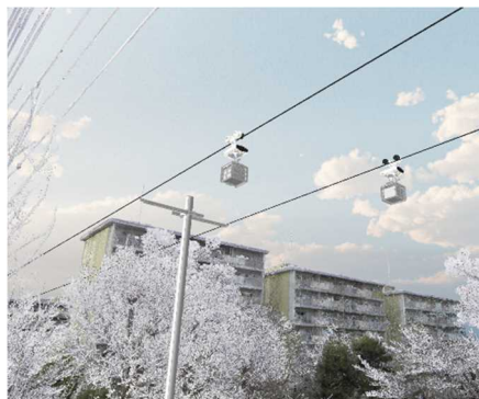
実証実験イメージ（CG）