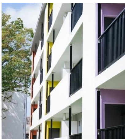
写真1 全面的に外壁を刷新

(株)フージャースアセットマネジメントは内装工事、外構整備を実施し、入居開始後は、賃貸住宅としての管理・経営を行っていきます。