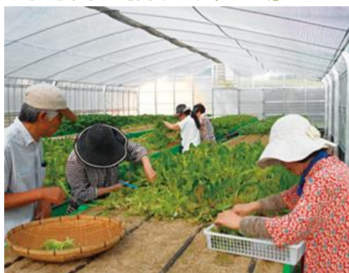
●日の里/福岡県宗像市 ●運営:東レ建設株式会社等

地域住民が協力して野菜を栽培し、朝市などのイベントを行う外、収穫した野菜を学校給食に提供するビニールハウス型農場。