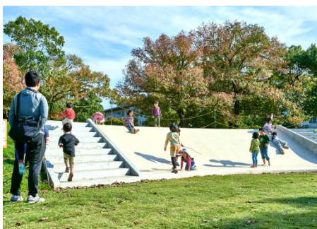
リニューアル後の公園～緑化により生まれ変わる～