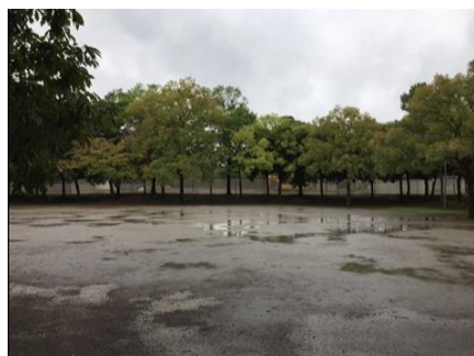
リニューアル前の公園

本プロジェクトの他に、不動産開発事業を担う(株)フージャースコーポレーションが、つくば市との連携による、「公園の再生」に取り組んでいます。（「竹園西広場公園」再生プロジェクト）