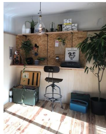
写真2・3 DIY・アウトドアをコンセプトとした住戸リノベーション