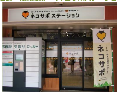
●多摩ニュータウン永山/東京都多摩市 ●運営:ヤマト運輸株式会社

コミュニティ活動・一括配送・家事・買い物代行サービス等の生活支援機能を付加した物流拠点。