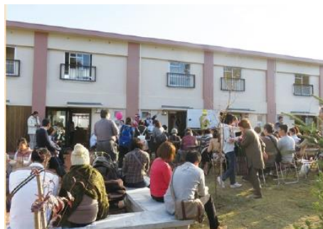
●ひばりが丘パークヒルズ/東京都西東京市 ●運営:一般社団法人まちにわ ひばりが丘

コミュニティスペース、カフェ、共同菜園や芝生広場、カーシェアを備えるコミュニティセンター。