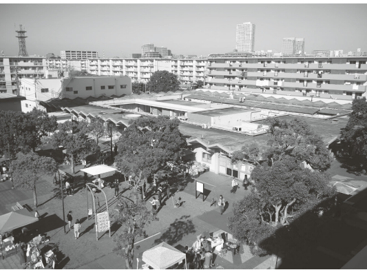
右／大型ブロックを自由に組み合わせたり、遊具に乗ったりして子どもたちが楽しんでいた。 左／「団地いどばたマーケット」は袖ヶ浦団地の広場で開かれた。

ドは、あそび道具の提供からあそび環境の創造、メンテナンスまで、「あそび」について総合的に取り組んでいる企業。近年では、体を動かすことの楽しさが実感できる環境づくりを通して、子どもをはじめとするすべての世代の健康づくりにも積極的に取り組んでいる。