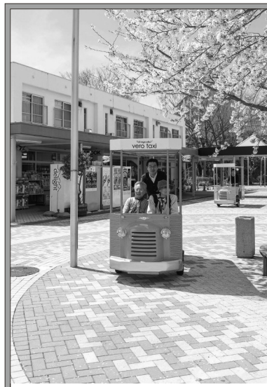
自転車タクシーは荷物や人を運ぶだけではなく、「コミュニティ」でもある。

もる人たちが何とかしたい。でもこちらが届けるのはよくない。外に出てきてもらわないと。何らかの移動手段を探していました」