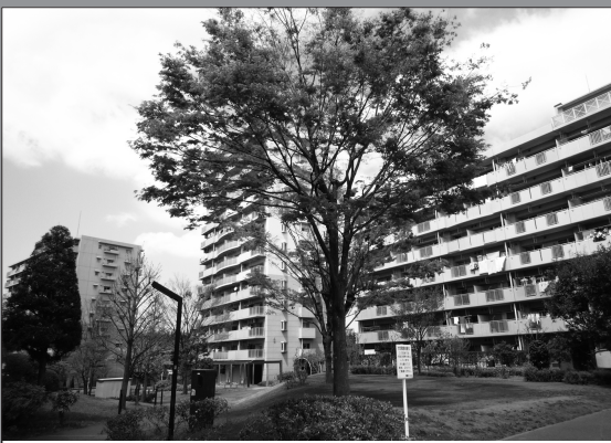
団地の外に子どもたちは探検に出掛ける