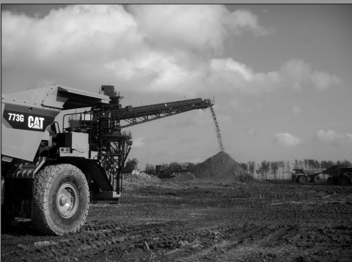
ベルトコンベヤーで運ばれる土砂を50tダンプが素早く運ぶ。