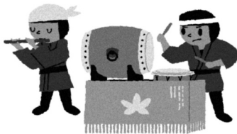
illustration: Shigeyuki Sakata