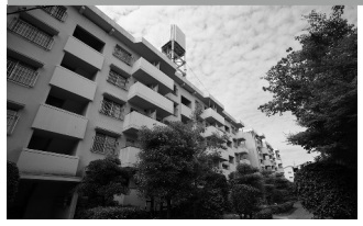
高置水槽が破損した健軍団地「写真上」と揺れが大きかった高層階のある世安町団地

14日の揺れのあと、さらなる大きな揺れが人々を襲ったのが、16日午前1時25分。これが「本震」