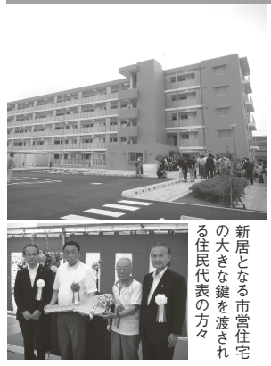
新居となる市営住宅の大きな鍵を渡される住民代表の方々

「当時URでは、復興スタンダードとして市や町から要請があったときにスピーディーに施行ができるよう、住宅のプランをあらかじめ考えておくということをやり始めていました。ですからこの名取市の建築計画にあたっては、URであらかじめ用意していたプランと、名取市が住民の方に提示して