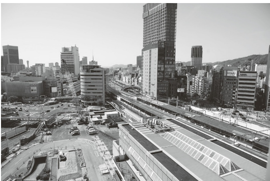
左は未来のJR三ノ宮新駅ビル。右は現在、新駅ビルを建設中の工事ヤード。

線をつくり、6つの鉄道駅の乗り換えがスムーズになるように繋ぐ。さらにはJRの改札から、人がまちへと流れる空間デザインにすることが計画されている。同時に、神戸市では、新駅ビルの面する三宮交差点周辺を「三宮クロススクエア」として整備。現在の10車線を6車線に縮小、周辺の民地も合わせて広場空間を創造。車の空間から人が主役の空間へと変換し、人が行き交い、集い、憩える、より便利で機能的な神戸の新しい象徴として再生する将来像を描いている。三宮周辺地区は、2つの事業の融合で大きな変換を遂げようとしているのだ。