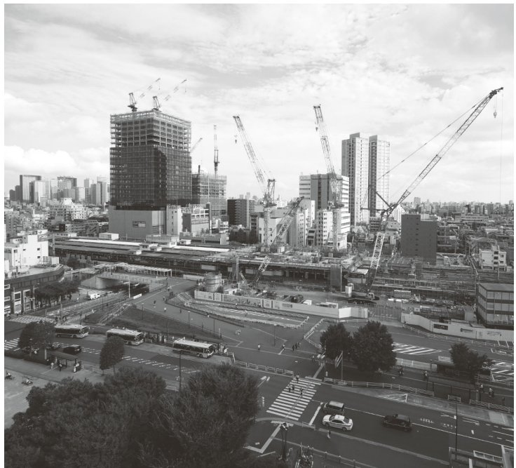
中野駅周辺が変貌し続けている。

中野駅周辺では、URはもう1か所、線路反対側の中野三丁目地区のまちづくりにも携わっている。小規模な建物が密集している地区に交通広場や区画道路などを整備するため、URが土地区画整理事業を施行するととも