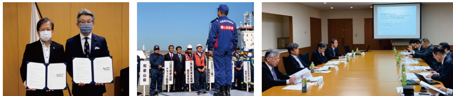
住家の被害認定業務支援に関する内閣府との協定締結