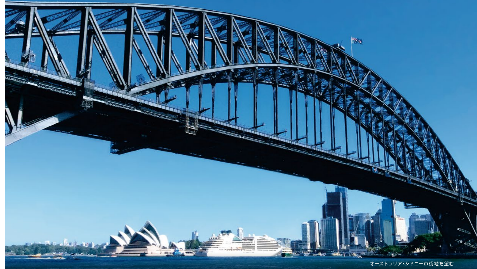
オーストラリア・シドニー市街地を望む