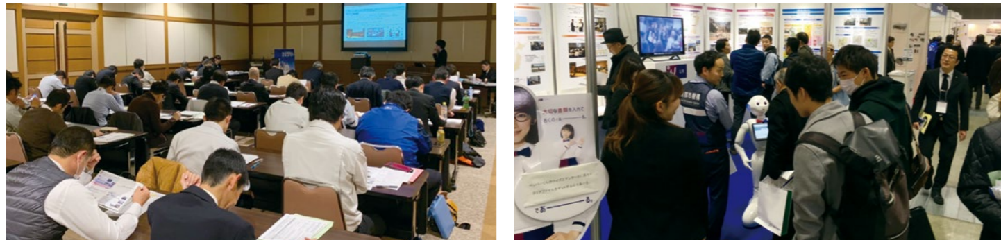
国土強靱化地域計画に関する会議への参加