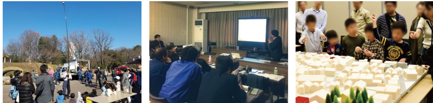
DANCHI Caravan in 町田山崎での防災ワークショップ