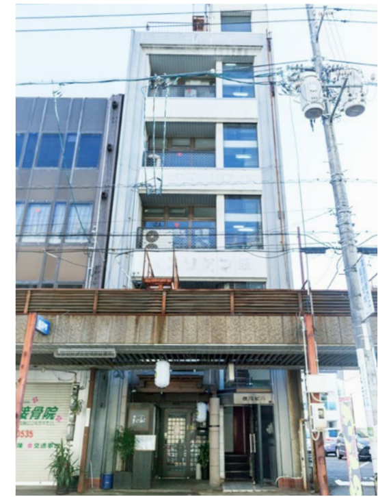
リノベーション物件の外観