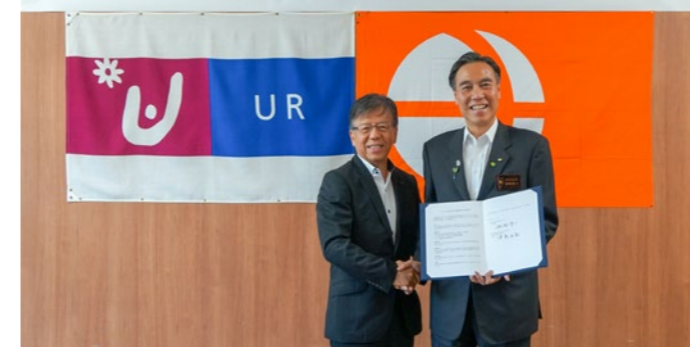
協定調印式の様子