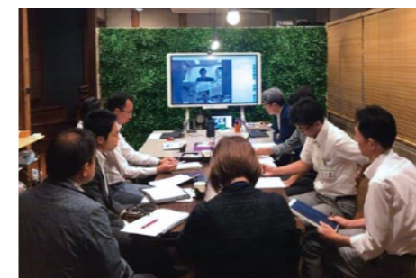
UDC信州事業推進会議の様子