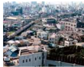
開発前の事業エリア