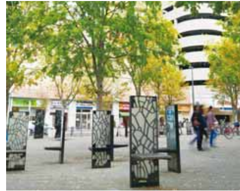
新たに整備された駅前広場