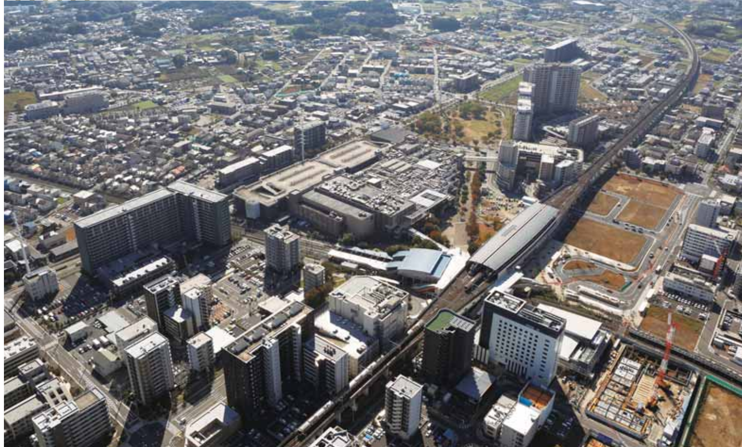
流山おおたかの森地区