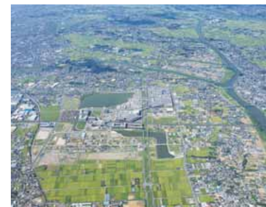
大きな河川に隣接する事業エリア(2014年8月撮影)

Awards Japan 2010年 生物多様性保護につながる企業のみどり100選 (流山おおたかの森地区)