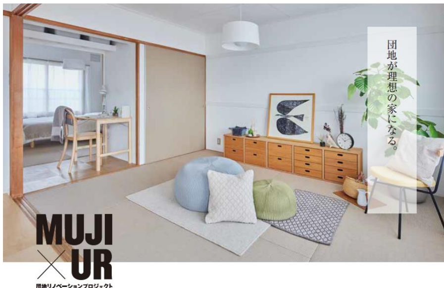
（北海道札幌市 澄川団地）

「MUJI×UR」の新プラン住戸のご取材をご希望される場合は、随時受け付けておりますのでUR都市機構までお問い合わせください。