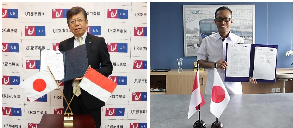
覚書署名時の様子

本覚書に基づく連携を通じて、ジャカルタ首都圏における TOD プロジェクトへの日本企業の参画機会創出を図って参ります。