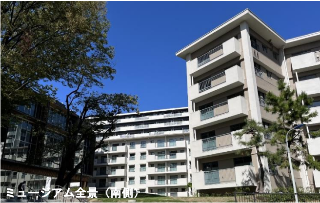
ミュージアム全景(南側)

登録有形文化財でもあるスターハウス等保存住棟4棟では、これからの暮らしの提案を行うほか、ストック社会に対応した改修技術等の実証フィールドとして活用します。当ミュージアムは、新たな暮らし方を探求し、トライアルする「まちづくりの実践場」として活動を展開します。