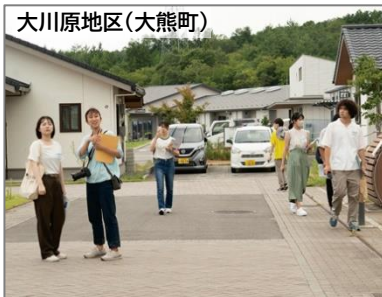
大川原地区(大熊町)