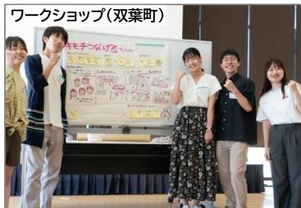
ワークショップ(双葉町)