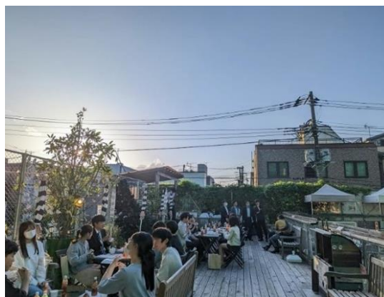
Liveビューイング後は座談会・交流会を開催

(お問い合わせ先) ※12/29~1/3及び土日祝日を除く 10:00~16:00