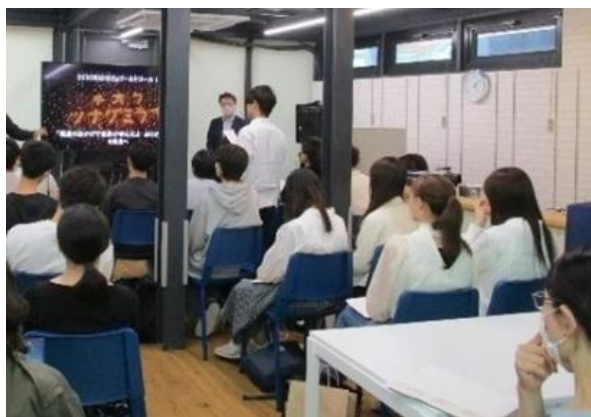
全国への配信に加え都内ではLiveビューイングを実施