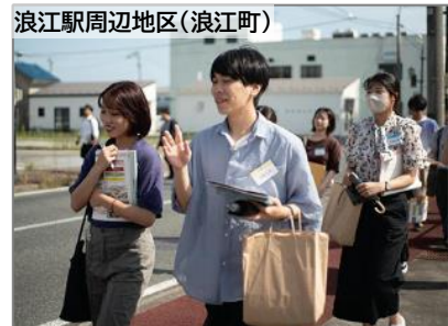
浪江駅周辺地区(浪江町)